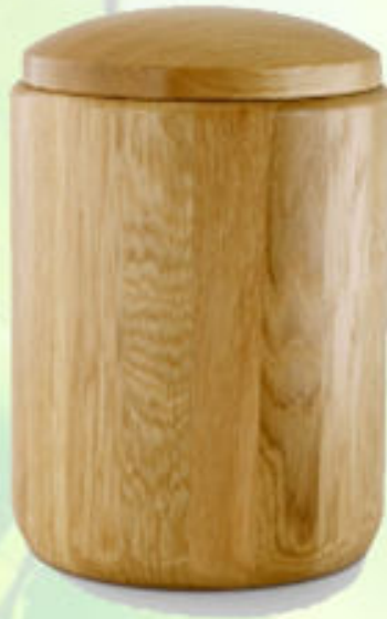
Holzurne Eiche gedrechselt; Modell H1E (Höhe 31,5 cm, ø 22,5 cm)*