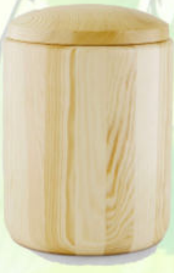
Holzurne Kiefer gedrechselt; Modell H1K (Höhe 31,5 cm, ø 22,5 cm)*

Derzeit verfügbare Urnenrohlinge die nach Ihren Wünschen Gestaltet werden können.