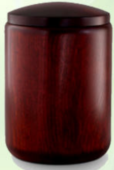
Holzurne Buche gedrechselt; Modell H1B (Höhe 31,5 cm, ø 22,5 cm)*

*Zum einsetzen einer Norm Aschekapsel (Höhe 21 cm ø 16,5 cm).